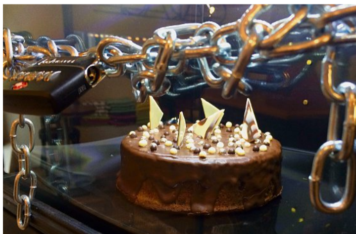
Das Ziel des Spiels ist es, den Kuchen zu befreien.

Corona hatte dem erst im Oktober 2019 eröffneten Spielraum einen Strich durch die Rechnung gemacht.